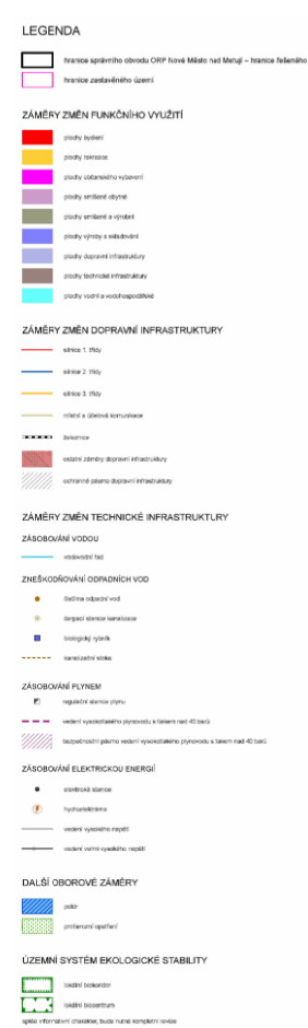
Výkres záměrů na provedení změn v území